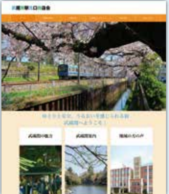
開設されたホームページ

台設置しました。ホームページでは、会員の紹介にとどまらず、冬の風物詩「関のボロ市」や武蔵関公園、亀の湯など武蔵関エリア全体の見所やスポット、地域住民の声などを紹介しています。