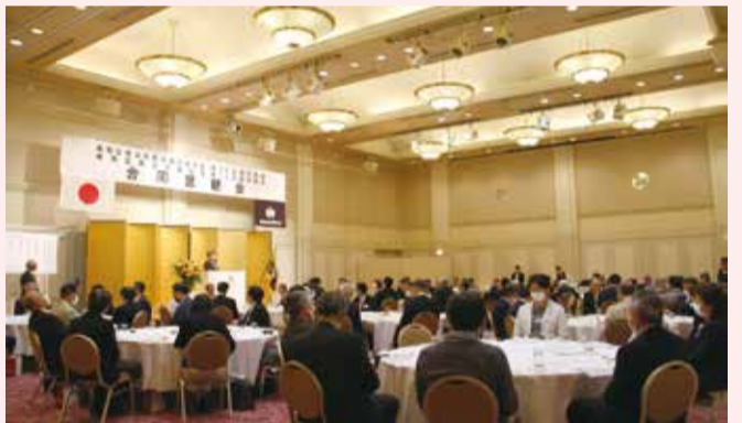
合同懇親会の様子