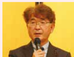
藤井たかし 練馬区議会議長

先日、豊島園駅のリニューアル記念セレモニーがあり、6月16日にハリーポッターの施設がオープンします。ゆくゆくは300万人が訪れると予想されており、練馬区の世界デビューになると思っております。11月19日には全国都市農業フェスティバルを開催いたします。区議会、国会のお力添えをいただきながら、皆様と我が街練馬をもっともっと発展させていきたいと思っております。