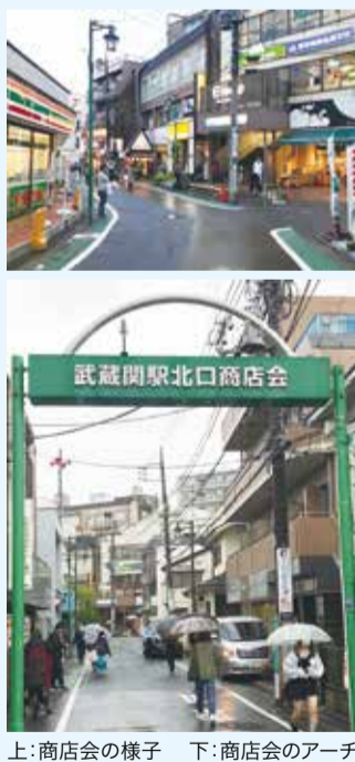
上: 商店会の様子 下: 商店会のアーチ

武蔵関駅北口商店会は、武蔵関北口から伸びる道の400〜500mほどの商店会です。昭和46年5月に若宮通り街路灯会として発足し、平成17年に現在の名称に変更しました。令和2年11月に8年ぶり2度目の就任となった平岩徳一会長にお話を伺いました。「小売よりも歯科医院や飲食店が多く、どの会員をとっても駅から2分くらいと近いのが特徴です。行列のできる青果の八百久さんは、もとは南口について駅から遠かったのですが、こちらに引っ越してきたんですよ。今年2月にホームページを開設したほか、3月に安全・安心に備えて防犯カメラを5