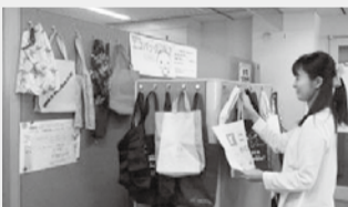
職員でマイバッグをシェア(区役所本庁舎)

将来の脱プラスチックに向けて、商店会の皆様と、今できることを、着実に進めていきたいと考えています。ご協力をお願いいたします。