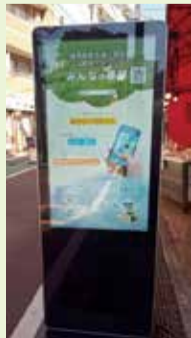
商店会では、いち早くデジタルサイネージを導入