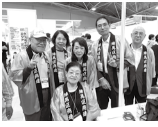
練馬まつりブースの様子