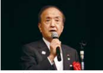
来賓の前川耀男練馬区長