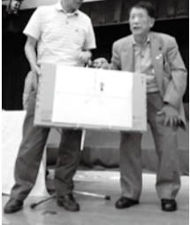
チャリティゴルフ大会の様子