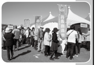
練馬まつり会場での様子