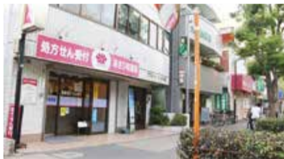
バス通りに面した商店街の様子

光が丘公園の西側、バス通り沿いから住宅街に広がる商店会です。「公園のあたりがグラントハイだった頃は、米軍の子どもたちが商店会にもよく買い物に来てた。『パパさん、ハマチちょうだい』ってさ。生鮮3品の店も揃っていたし、店を開けておけば