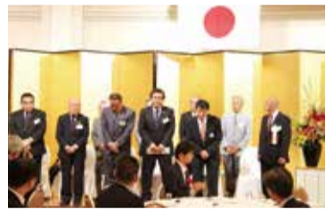
壇上に並ぶ新理事

望が開けるのであります。会員の皆様と一体となつて、この厳しい経済状況で、諸々の問題に関わり、改革・改善を積み重ねて参ります」と述べ、さらに今秋予定のまちゼミについても理解と協力を求めました。