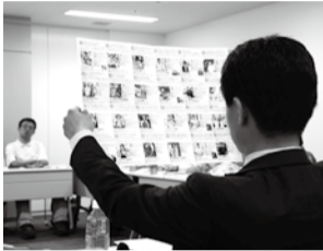
「まちゼミ」のチラシ