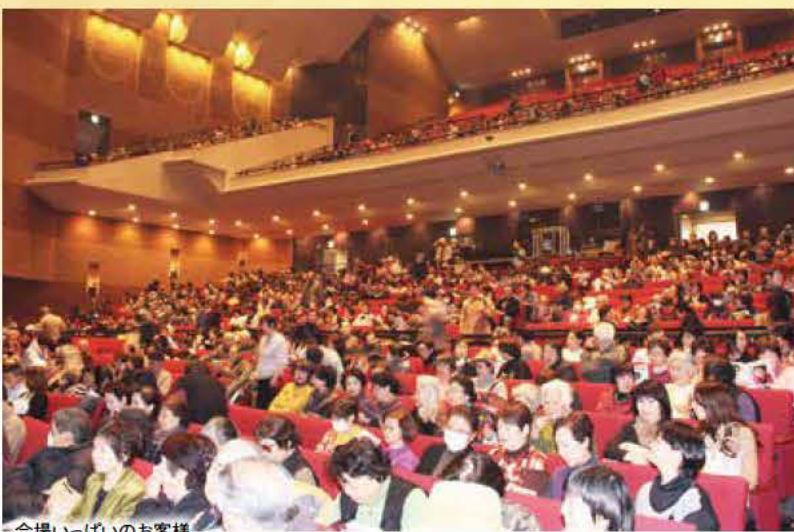
会場いっぱいのお客様

2月5日(火)、練馬文化センター大ホールで、練馬区商業まつり歳末売出し招待会が開催されました。特賞を当てたお客様を「招待」。来場者は昼の部1171名、夜の部1226名。コロケさんによる爆笑モノマネのオンパレードで、お客様の明るい笑い声が会場いっぱい響き渡りました。不景気を吹き飛ばすようなひとときを、日頃商店街を「愛顧」くださるお客様へプレゼントすることができました。