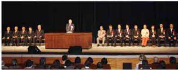
登壇する来賓及び商業まつり実行委員

練馬区商店街連合会は、共通商品券の販売を通じて「練馬みどりの葉っぱい基金」に協力しております。