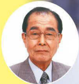
練馬区長 志村豊志郎