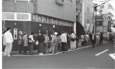
(第10ブロック) マーテルハウス(株)前