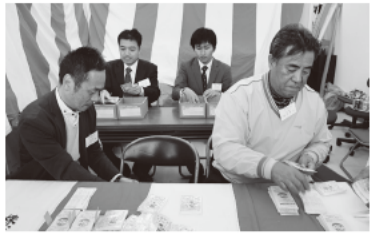
(第5ブロック) (株)マルマン前

平和台4-2-18 朝から晴天でしたが、風が冷たく、寒そうなお姿が目立ちました。朝一番に並ばれた高齢の主婦の方は、7時55分に着いたとのこと。本を読んで待つ方も多く見かけました。 今回の売り出しを知ったのは、大半の方が区報でしたが、商店会に貼り出されたポスターで知った方も多かったようです。 お客様に使って道を探ると、中年の男性のほとんどの方は「妻に任せている」との回答。肝心の主婦層は、「日用品に使う」というコメントが多数を占めました。また、「美容院で使う」「メガネを買う予定」など具体的な答えもありました。 整理券を配った後も、列