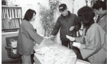
(第10ブロック) マーテルハウス(株)前

た、通りすがりの人は当日の行列を見て、「何の行列?」と驚いて尋ねる方も多かったです。 お客様に使って道を探ると、中年の男性のほとんどの方は「妻に任せている」との回答。肝心の主婦層は、「日用品に使う」というコメントが多数を占めました。また、「美容院で使う」「メガネを買う予定」など具体的な答えもありました。 整理券を配った後も、列を崩さないまま並び、9時の行列を見て、「何の行列?」と驚いて尋ねる方も多かったです。 お客様に使って道を探ると、中年の男性のほとんどの方は「妻に任せている」との回答。肝心の主婦層は、「日用品に使う」というコメントが多数を占めました。また、「美容院で使う」「メガネを買う予定」など具体的な答えもありました。 整理券を配った後も、列