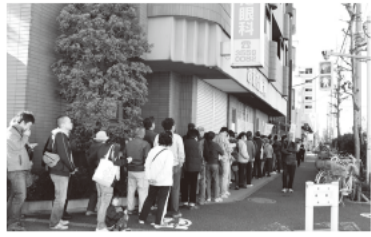
(第5ブロック) (株)マルマン前

平和台4-2-18 朝から晴天でしたが、風が冷たく、寒そうなお姿が目立ちました。朝一番に並ばれた高齢の主婦の方は、7時55分に着いたとのこと。本を読んで待つ方も多く見かけました。 今回の売り出しを知ったのは、大半の方が区報でしたが、商店会に貼り出されたポスターで知った方も多かったようです。 お客様に使って道を探ると、中年の男性のほとんどの方は「妻に任せている」との回答。肝心の主婦層は、「日用品に使う」というコメントが多数を占めました。また、「美容院で使う」「メガネを買う予定」など具体的な答えもありました。 整理券を配った後も、列