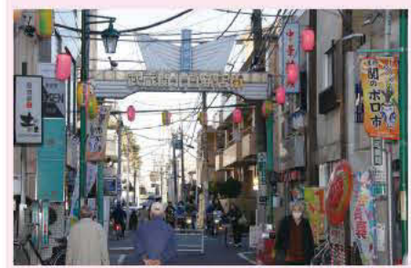
商店会アーチと通りの様子