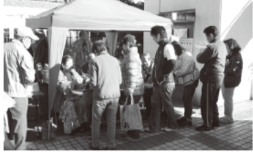
(第9ブロック) 旭町南地区区民館前