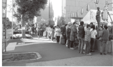
(第9ブロック) 旭町南地区区民館前