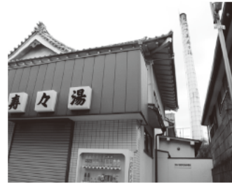
開店前の美寿々湯入口。右手奥に見えるのが煙突

昭和20年(1945年)石川県生まれ。父親が居抜きで買った美寿々湯を、昭和60年に継ぎ二代目となる。昭和41年に建てられた建物は平成2年に一部改築。16時開店。月曜定休。練馬区公衆浴場組合の組合長として2期4年目。 練馬区大泉町6-10-2 ☎03-3921-2668