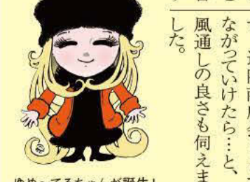
ゆめ〜てるちゃんが誕生!

抽選会をするのですが、5〜6割の回収率で、多くのお客様が楽しみにいらしてくださいます。また、景品も『空くじなし』としたそう。お金は多少かかりますが、せっかくならばお金の名称も『銀河の夜の盆踊り』と変更されたい。今年のお客様をがっかりさせないようとの配慮から。全会員参加型にする前には、参加希望店が減る一方でついには20数件まで落ち込んだと言います。全店で売出しをするのでイベントとして盛り上がり、お客さまサービスになるんですね。また、盆踊りだけでなく、アニソンやプラスバンド、ヒップホップの披露など、子どもからお年寄りまで楽しめる企画がいっぱい。