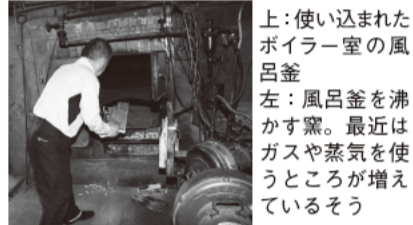
上:使い込まれたボイラー室の風呂釜 左:風呂釜を沸かす窯。最近ではガスや蒸気を使っているそう