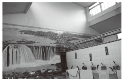
ナイアガラの滝のタイル絵が圧巻!