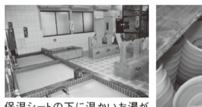
保温シートの下に温かいお湯が張ってある 消毒中の風呂桶