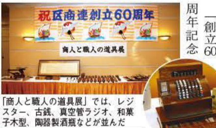
「商人と職人の道具展」では、レジスター、古銭、真空管ラジオ、和菓子木型、陶器製酒瓶などが並んだ

また、区民の高齢化が進み、買い物支援事業に東京で一番最初に練馬区が取り組みを始めました。その結果が今後、各市区町村にも波及していくと思われ、東京都産業労働局商工部も大変関心を持っています。練馬区の行政も商店街も前向きなので、私も大変心強く思っております。