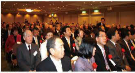
記念式典会場の様子