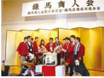
練馬商人会 練馬区商店街連合会