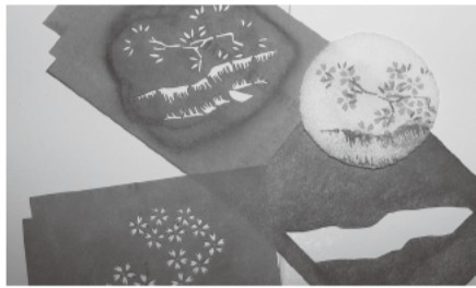
原画から渋紙に切り出していくのも、干菓子職人の仕事のひとつ