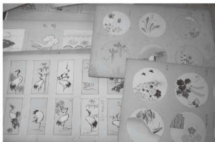
干菓子の雪平に描くための原画