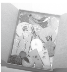
見るだけでも楽しい干菓子の折箱

など縁起のいいかわいらしい干菓子が、まさに工芸菓子という言葉がぴったりです。丸い雪