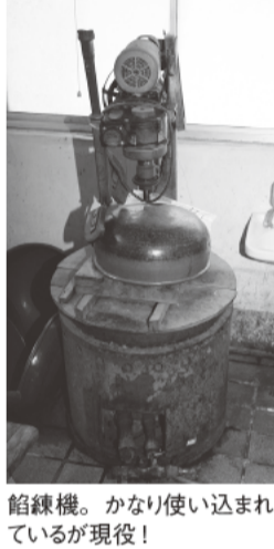
餡練機。かなり使い込まれているが現役!