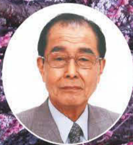
練馬区長 志村豊志郎